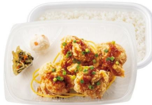
絶品旨ダレ！ 4 コ入り油淋鶏弁当 620 円