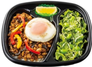
気軽に本格タイ料理！ ガパオライス 630 円

ジューシーなから揚げに、ごま油、生姜、香味野菜の風味が効いた特製ダレをたっぷりかけた、やみつきになる味わいです。さらに、卵とネギを使用し、香味油で仕上げた「炒飯」とセットになった『4 コ入り油淋鶏&炒飯弁当』は中華料理の魅力存分に味わうことができます。思う存分油淋鶏を食べたい方には、油淋鶏 1 コ辺りの値段がお得な『6 コ入り油淋鶏弁当』がおすすめです。