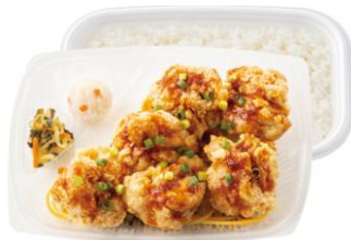
4 コ入りよりもお得！ 6 コ入り油淋鶏弁当 800 円