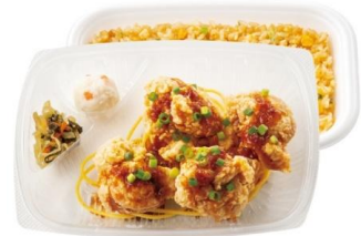
絶品旨ダレ！ 4 コ入り油淋鶏&炒飯弁当 820 円