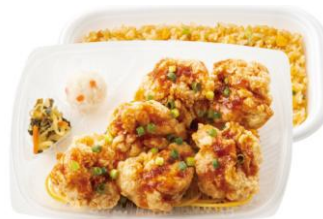
4 コ入りよりもお得！ 6 コ入り油淋鶏&炒飯弁当 990 円