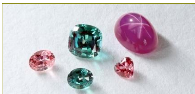
「ビズー」が取り扱う人工カラーストーン 6月の誕生石「アレキサンドライト」(中央)、 7月「ルビー」(右上)、9月「サファイア」(左端・右下)

新発売の9月の誕生石「サファイア」のほかで、6月の誕生石「アレキサンドライト」、7月の誕生石「ルビー(スタールビー)」を、「ラボグロウン・シリーズ」から展開しています。