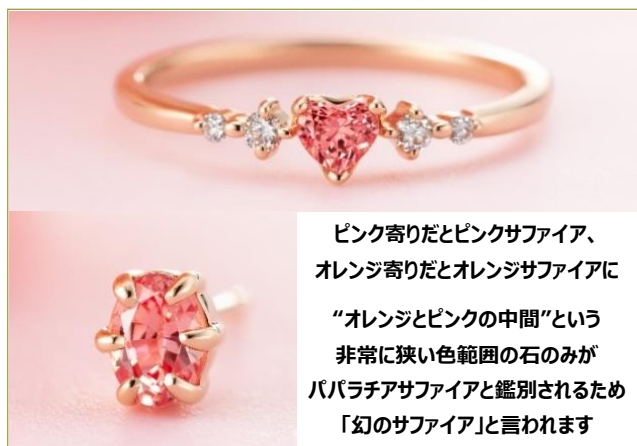
ピンク寄りだとピンクサファイア、 オレンジ寄りだとオレンジサファイアに “オレンジとピンクの中間”という 非常に狭い色範囲の石のみが パパラチアサファイアと鑑別されるため 「幻のサファイア」と言われます

オレンジとピンクの中間の色味が絶妙な天然の「パパラチアサファイア」は、“幻のサファイア”と呼ばれる希少石です。シンハラ語で「蓮の花の色」を意味する「パパラチア」の輝きが、手元や耳元を華やかにします。