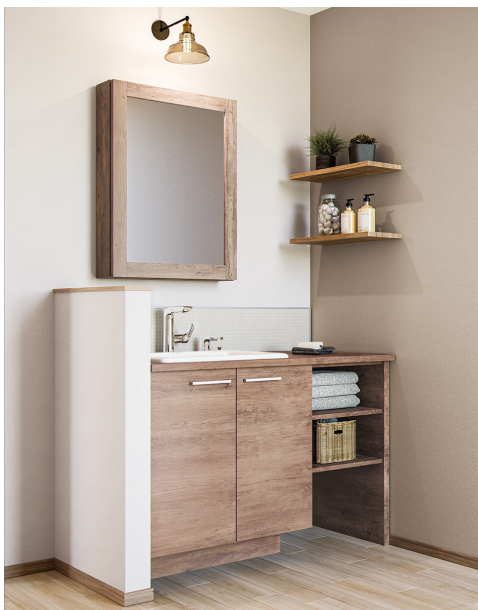
玄関先の手洗いスペースにもおすすめ：RE55393・55396

「ハイドロテクト」は、光触媒を利用し光や水の力で地球も暮らしもきれいにする、TOTO の環境浄化技術です。ライトフレッシュ壁紙ではこの技術を活用するとともに、水まわり空間のトレンド等を踏まえて共同で色柄を選定しました。マットな質感と落ち着いたカラー展開で、水まわりリフォームのトレンドの一つである“居室のようにリラックスできる空間”を演出できます。抗ウイルス性能でより清潔に、水まわりはもちろん住宅のあらゆるエリアにおすすめの5柄20点のラインアップとしています。