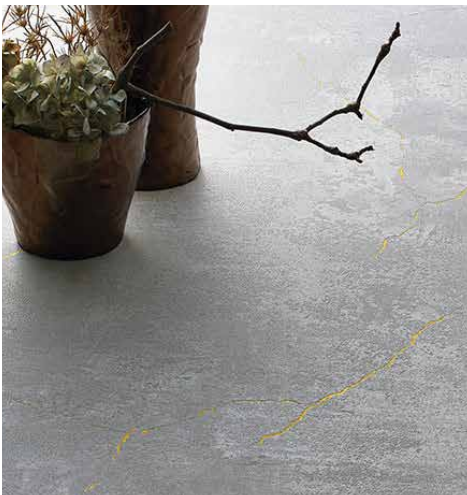
施工例：クラックモルタル PM-20203

時を経て風合いを増した木目柄と同調したエンボスが、本物の木のような質感を再現 施工例：エイジドパイン PM-20201