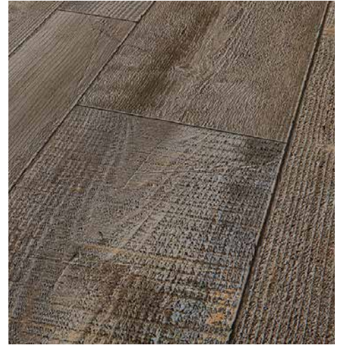
施工例：エイジドパイン PM-20202

時を経て風合いを増した木目柄と同調したエンボスが、本物の木のような質感を再現 施工例：エイジドパイン PM-20201