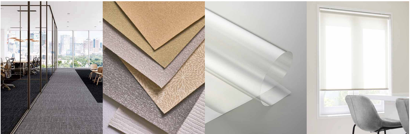
「NT double eco」「MEGUReWALL（メグリウォール）」「クリエイシア 90」「CS（シーエス）ロールスクリーン」の4商品で同時受賞

当社は、低環境負荷商品の開発を通じて、サンゲツグループ長期ビジョン【DESIGN 2030】に掲げる持続可能な社会の実現を目指しています。今回は、低環境負荷商品の中から3商品が受賞したほか、子どもの安全につながる商品が評価を受けました。今後も商品自体のデザイン性に加え、地球環境・生活環境の向上に貢献する商品の開発に取り組んでいきます。