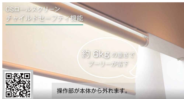
CSロールスクリーン紹介動画 https://youtu.be/htw5aX-l1-s