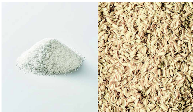
表面材にリサイクル材を使用（左：リサイクル樹脂/右：もみ殻）