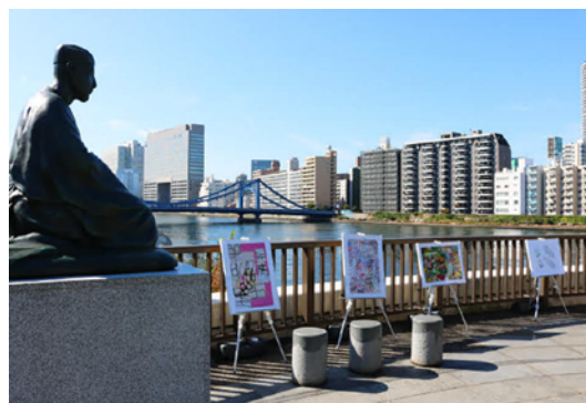
神社仏閣がある伝統的な街並みと、都会の街並みに色とりどりのアートが並ぶ