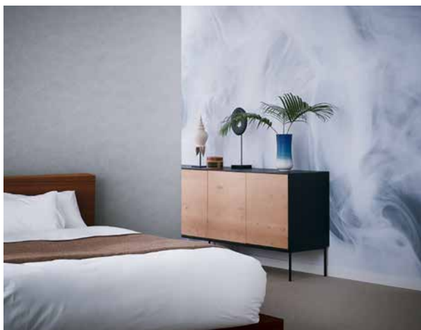
「process#100」HZ-5207 ミステック ヘイズ 「process#100」にデジタルプリントならではの柄を活かしたデザインが新登場