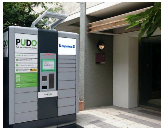
PUDO ステーション (レオパレス RX 中野坂上)

第一弾として、東京都中野区の物件「レオパレス RX 中野坂上」に屋外型タイプの宅配便ロッカーを設置し、サービスを開始します。