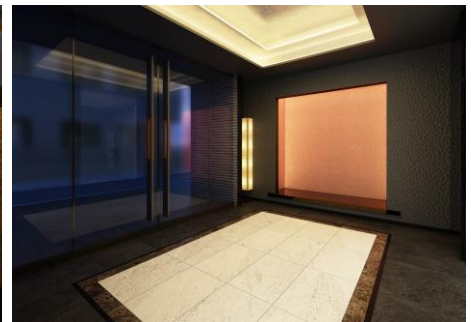
LOVIE 麻布十番 エントランスイメージ図