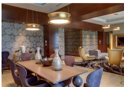
プレジデンシャルスイート