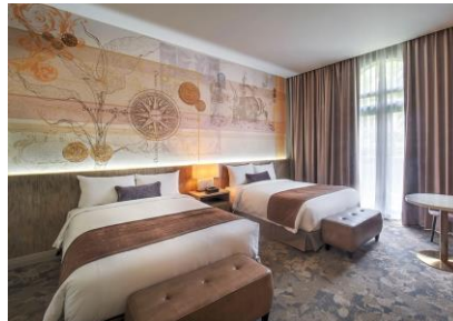
プレミアールーム