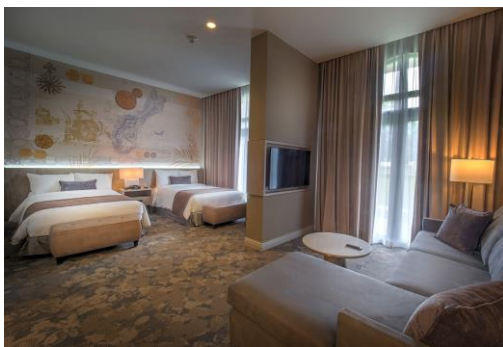
ラグジュアリールーム