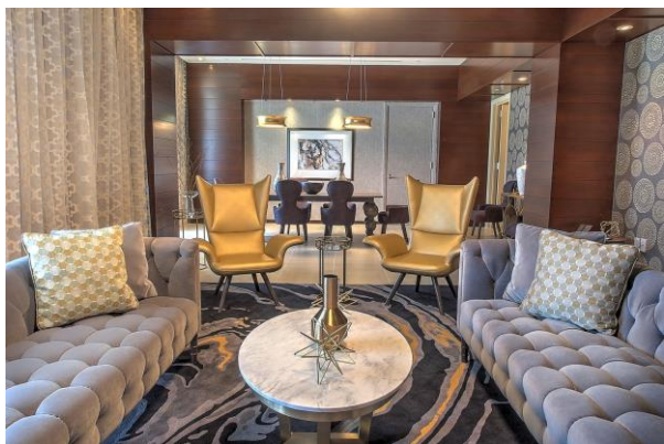
メダリオンフロア プレジデンシャルスイート

JTBのホテルグレードは、JTBが長年の経験を通じて多くのお客様の評価と添乗員のレポートなどをもとに評価したホテルグレードです。グアムにおけるホテルグレードはDグレードからLグレードの5段階となっており、今回『レオパレスリゾートグアム レオパレスホテル』が認定される「Lグレード」は、グアムにおいて最上位のグレードです。「その国、都市を代表する名門ホテル」と評価されたホテルのグレードである「Lグレード」を獲得したホテルとしては、グアム島内では2軒目のホテルとなります。