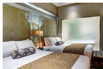
メダリオンルーム