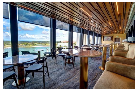
メダリオンラウンジ