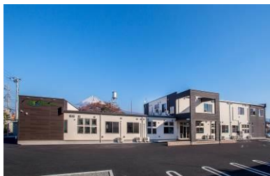
あずみ苑富士 外観