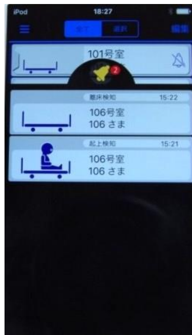
iPod touch 表示画面 (離床時アラーム検知)