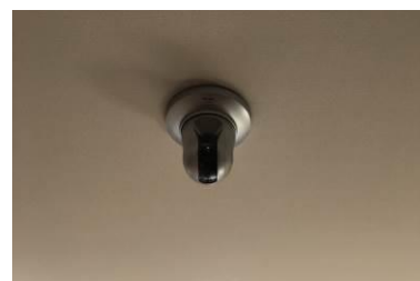
見守り防犯カメラシステム