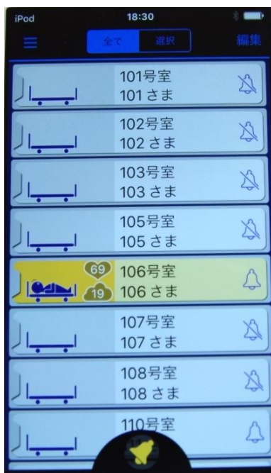
iPod touch 表示画面 (寝ている状態)