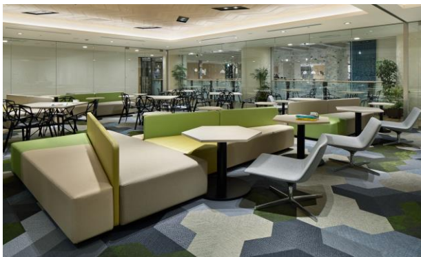
宿泊者専用ラウンジ