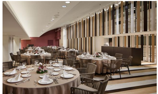
プールバンケット (円卓バージョン)