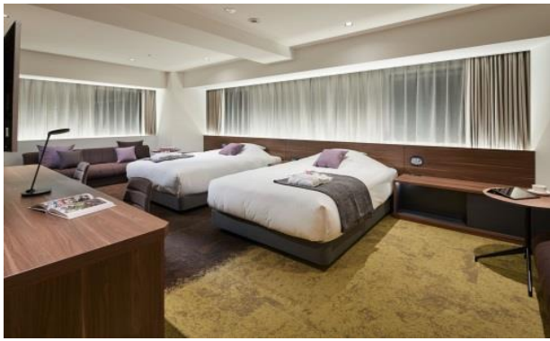
客室(ダブルルーム)