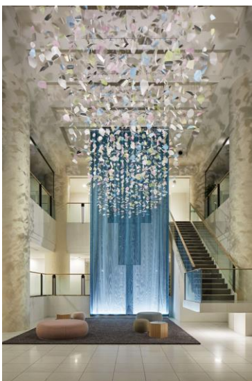
エントランス・ホール