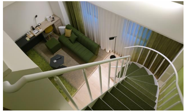
客室(メゾネットルーム)