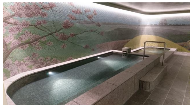
大浴場(春バージョン)