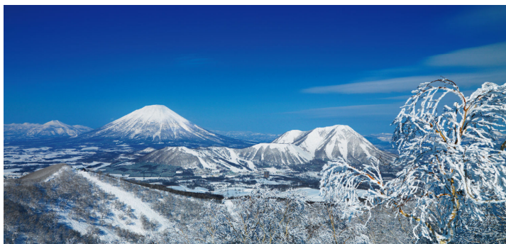
ルスツリゾート(加森観光)

アパート賃貸業務では国内最大手の株式会社レオパレス 21(本社:東京都中野区)と、北海道を中心に全国約 40 箇所でリゾート・観光施設を運営する加森観光株式会社(本社:札幌市)が、この度業務提携をいたしました。提携により、双方のユーザー様の利便性が向上し、両社施設の利用が一層促進されます。今後も多くの皆さまに、より良いサービスの提供に努めて参ります。