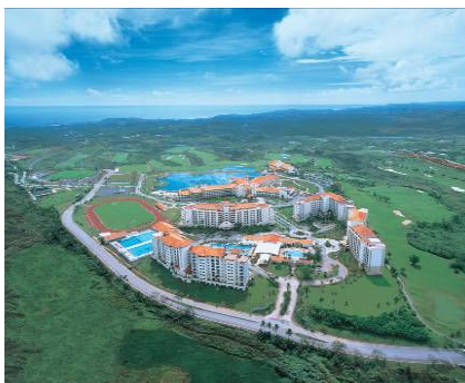
レオパレスリゾートグアム