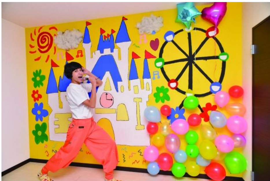
「けみおくん」がカスタマイズしたショールーム

URL http://www.leopalace21.com/special/kemio/index.html