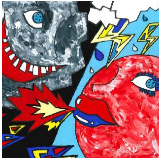
最優秀賞「Cloud, Sun, and You」