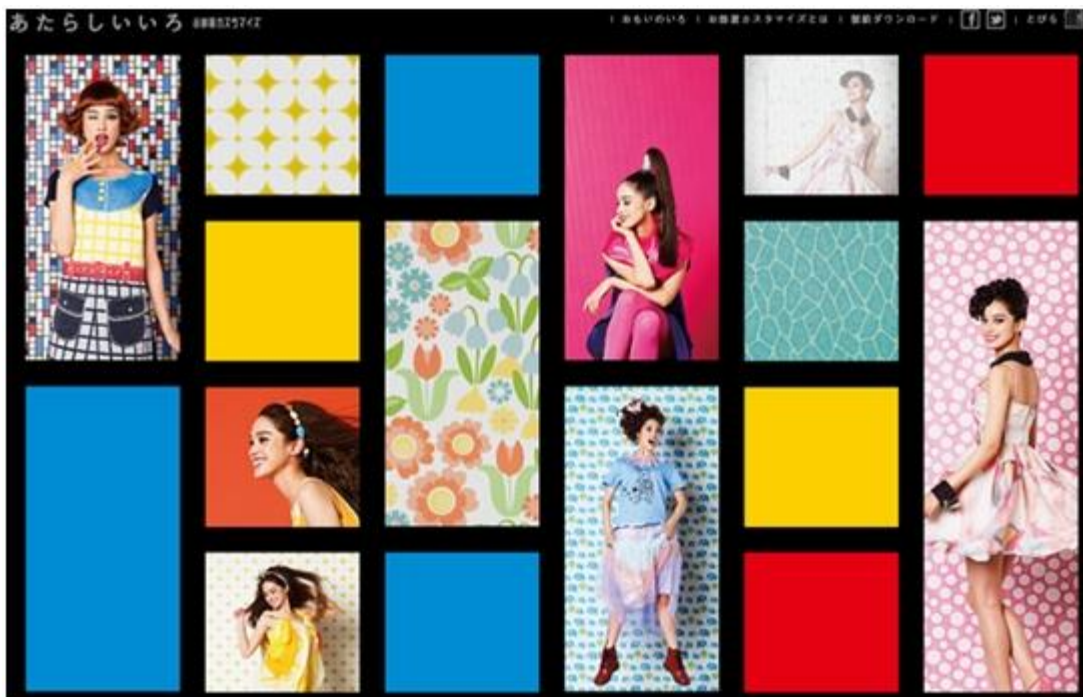
スペシャルサイト TOP イメージ

URL http://www.leopalace21.com/special/customize/atarashii/index.html