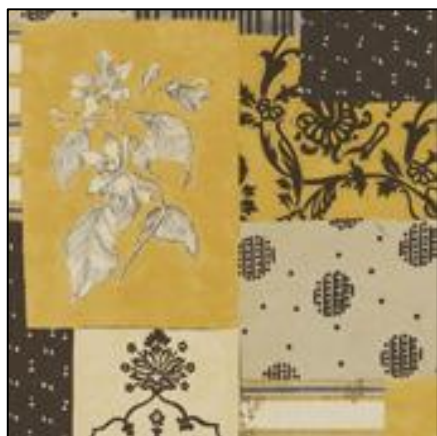
「パッチワークフラワー」