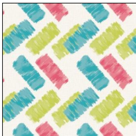
「ギザギザペイント」※タッキースタイル