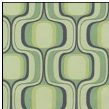
「ノルディックグリーン」