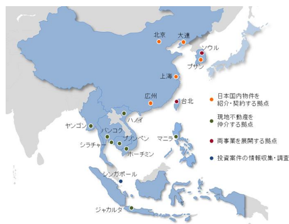
全16拠点の海外拠点

レオパレス21は、サービスアパートメント・オフィス事業に加え、海外赴任をトータルでサポートする「ワールドビジネスサポート」も展開しております。日系企業の海外進出を全面的にサポートすることで、海外でのレオパレスブランドの構築を目指すとともに、国内での賃貸取引企業様との関係強化も図ってまいります。