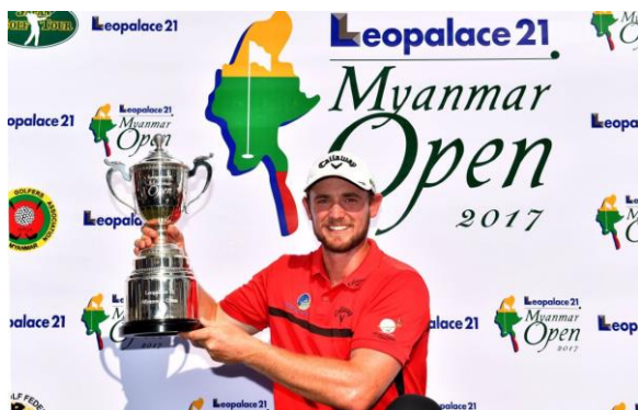
トッド・シノット選手

2017年1月26日(木)～29日(日)、パンラインゴルフクラブにて開催された「レオパレス 21 ミャンマーオープン 2017」はツアープレイヤー145名、アマチュア5名の全150名が出場し、オーストラリアのトッド・シノット選手が最終日に6バーディノーボギーの完璧なゴルフで見事な逆転優勝を飾りました。3日目まで首位だった宮里優作選手、および「レオパレス 21 ミャンマーオープン 2016」2位タイの矢野東選手はトータル9アンダーの6位タイとなる活躍をしました。