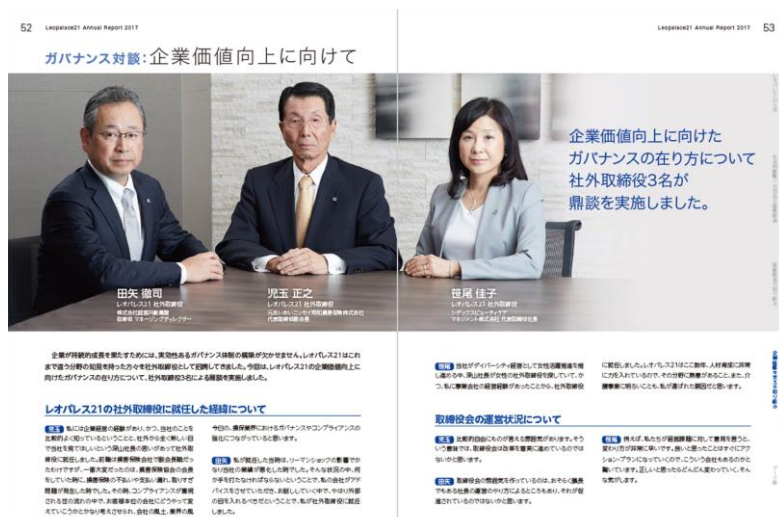
2017年統合報告書 社外取締役鼎談ページ

PDF版: http://www.leopalace21.co.jp/ir/library/pdf/annual_report/2017/jp.pdf