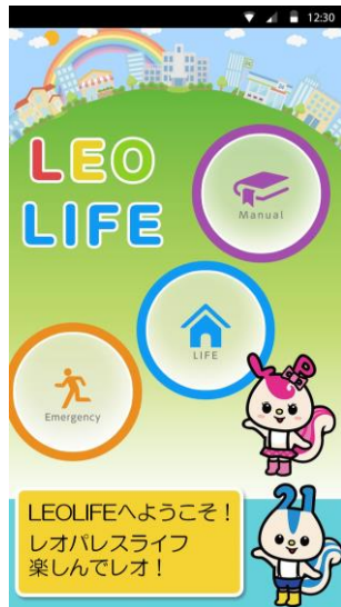
入居者様向けアプリ

「LEOLIFE」は、入居者様、オーナー様向けにも提供をしており、災害発生時の安否確認をプッシュ通知で迅速に行っているほか、災害情報や防災お役立ち情報をお届けしています。また、2016年よりクラウド型防犯カメラを導入したことで、カメラ設置物件については建物の被害状況を本部にいながリアルタイムで確認できるようになりました。このようにBCP対策においてもIT化を進めることで、入居者様・オーナー様の被害状況の迅速な把握・安否確認に努めており、この度の西日本豪雨災害の際には、災害発生から約1週間後の7月17日に被災地域にお住まいの入居者様・オーナー様約900名の安否確認を完了しました。今後もアプリの活用方法の周知、使いやすさの追求を進めることで、ステークホルダーの皆さまの安全な暮らしをサポートできるよう努めてまいります。