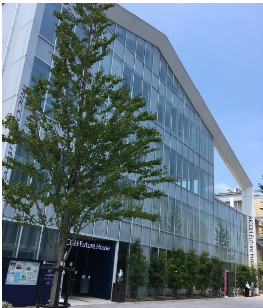
海老名にあるコワーキングオフィスビル

東京都・神奈川県にあるコワーキングスペース4ヶ所(練馬、池袋、新宿、海老名)にて計4名がテレワークを実施しました。外部のオフィスで仕事を行うことによる「集中度の変化」、社外の方もいる環境での「セキュリティー面」、他社社員との「情報交換・交流」ができるかなどを、実施者にヒアリングし本格導入できるかを検討いたします。