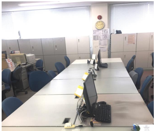
テレワーク実施時の様子