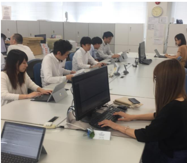
通常出勤時の様子

この結果から踏まえて、実際に災害が発生した際は、5分後には安否確認を完了できるよう、社員へのアプリ活用方法の周知および定期的な訓練の実施の必要性が浮き彫りとなりました。今後、部署全員がテレワークを実施したことで業務活動に影響があったかなどのヒアリングを実施し、課題の見える化、マニュアル整備などを行ってまいります。