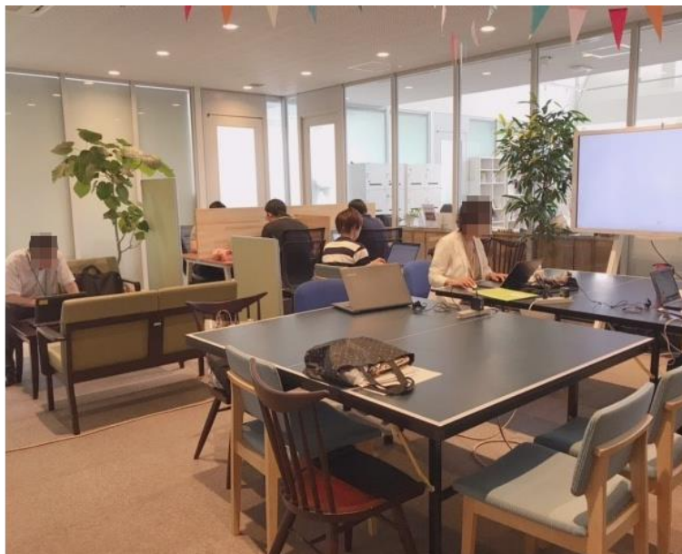
神奈川県在住の社員が 海老名のコワーキングスペースにて勤務