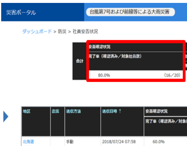
社員の安否確認状況