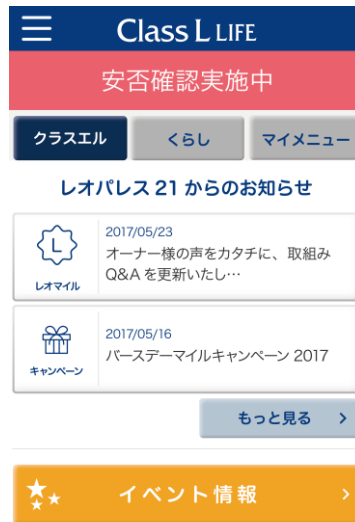
オーナー様向けアプリ