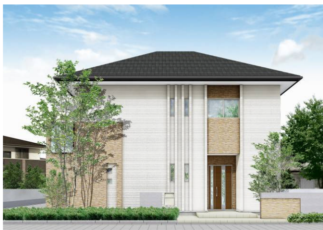
natural-style 玄関側(オプション仕様)

株式会社レオパレス21(本社:東京都中野区、社長:深山英世)は、平成25年4月4日より鉄骨ブレース工法の賃貸併用住宅「Smaio(スマイオ)」を販売します。「日本の住まいを新しく、快適に」をテーマに、敷地とライフスタイルに合わせて自宅を自由に設計し、併設された賃貸住宅は当社が一括借上げすることで、安定した家賃収入を得ることが可能です。