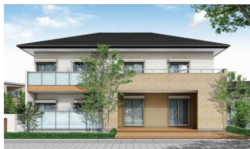
natural-style バルコニー側(オプション仕様)