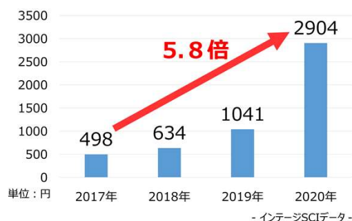
▼オートミールの購入金額推移（100人当たり 全国）