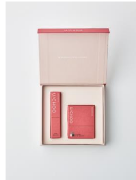
BELLINI SET BOX