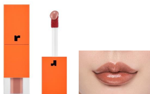
04 ダリアアンバー スパイシーロゼブラウン