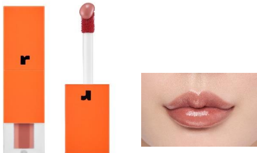
01 ピンクサザンカ ダスティコーラルピンク