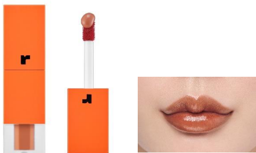
03 クッキーコスモス ヴィンテージブリックブラウン