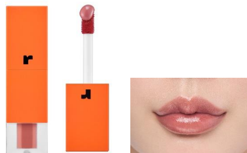
02 ベイビーポピー モーヴフレンチピンク