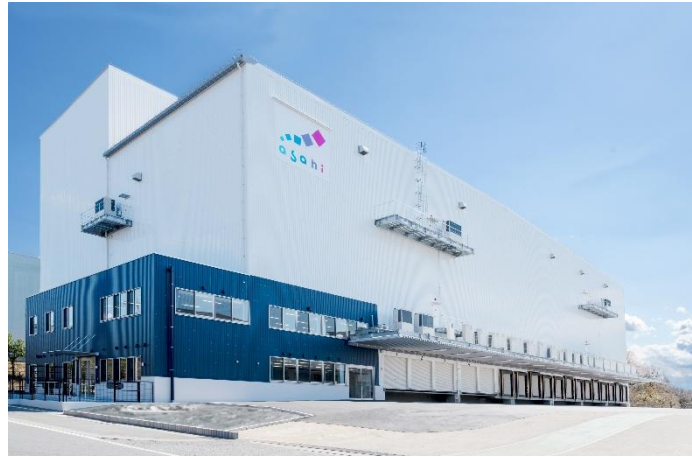
(新)花見台共配センター