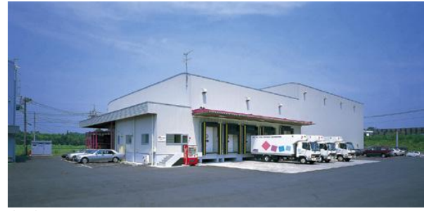
(旧)花見台チルド・フローズン棟 (新センター稼働後も旧チルド・フローズン棟は改修し、引き続き活用予定となっています)