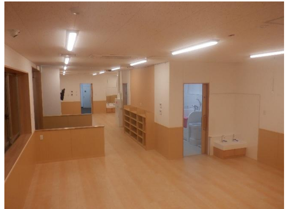
アサヒキッズランド嵐山花見台保育園