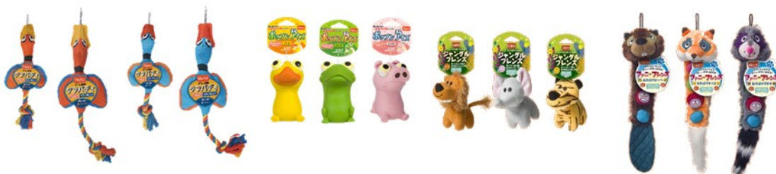
ファニーフレンズ