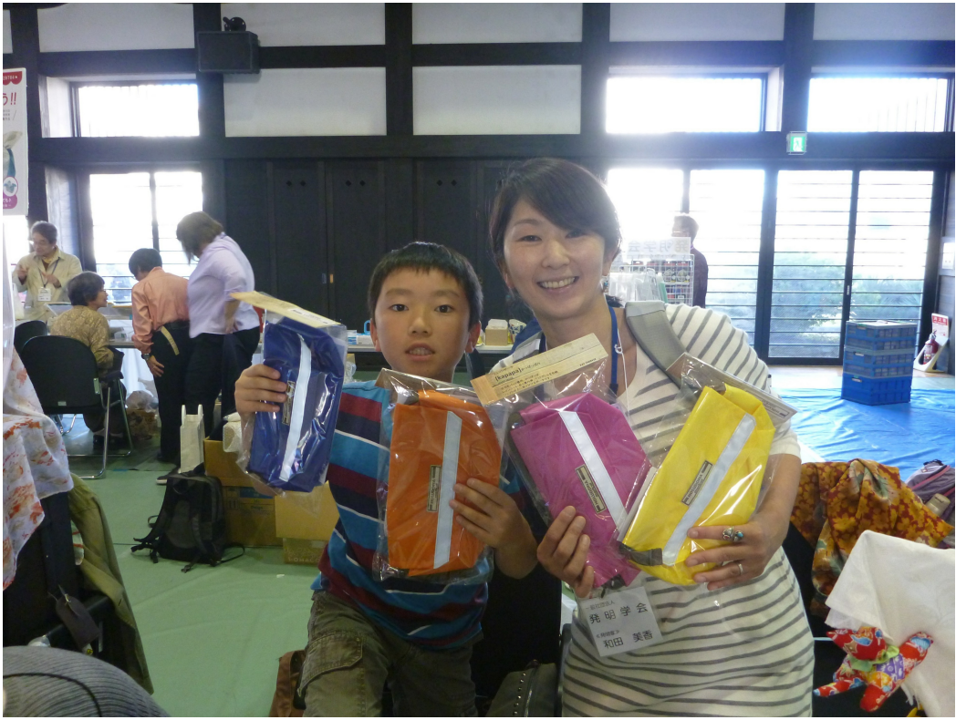
息子とテスト販売