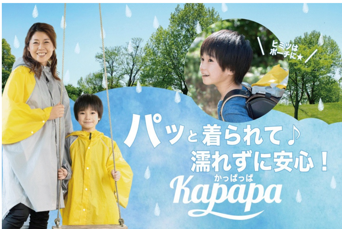
トップメイン画像

神奈川県横浜市の発明ママが、 ママ達で開発した親子お揃いの「オリジナルポンチョ」と 特許取得・神奈川県なでしこブランド2018認定品の 「雨具収納ポーチかっぱっぱ」セットで 4月に新発売に向けてクラウドファンディングを実施