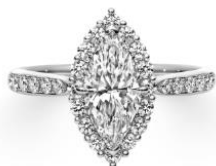
MARQUISE CUT マーキーズカット