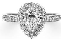
PEAR SHAPE CUT ペアシェイプカット