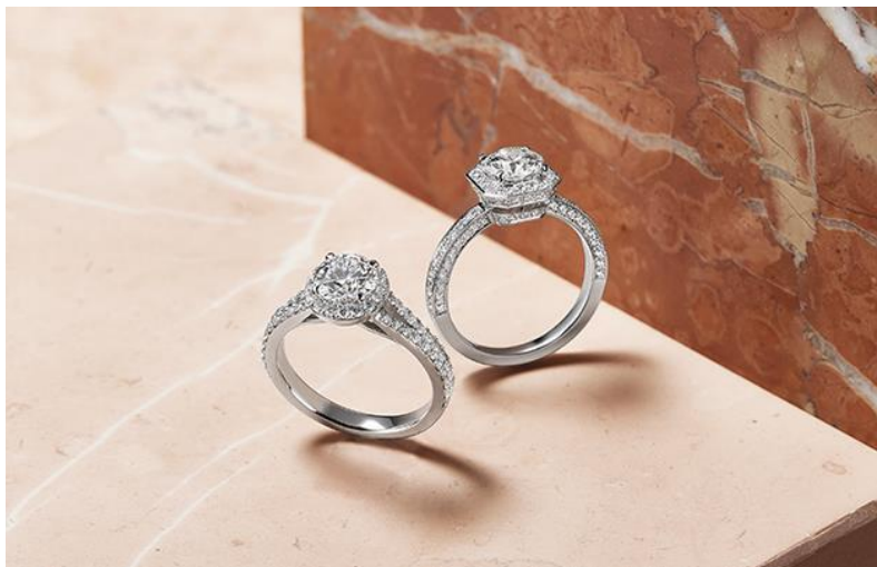
写真左：Quasar(クエーサー)、写真右：Filum(フィールム)