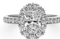
OVAL CUT オーバルカット