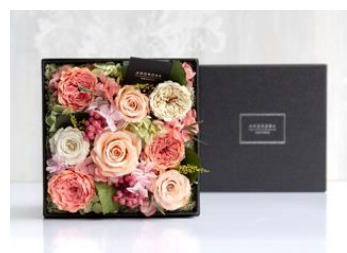
プリザーブドフラワーボックス