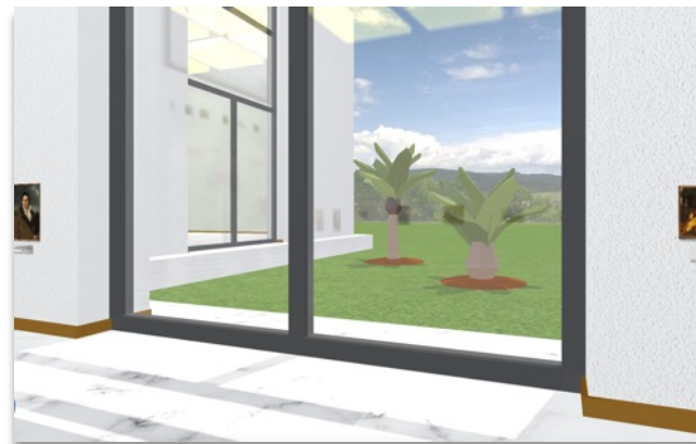
屋外の景観もVRで再現