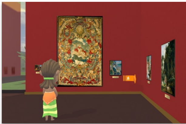
原寸展示でスケール感を体感