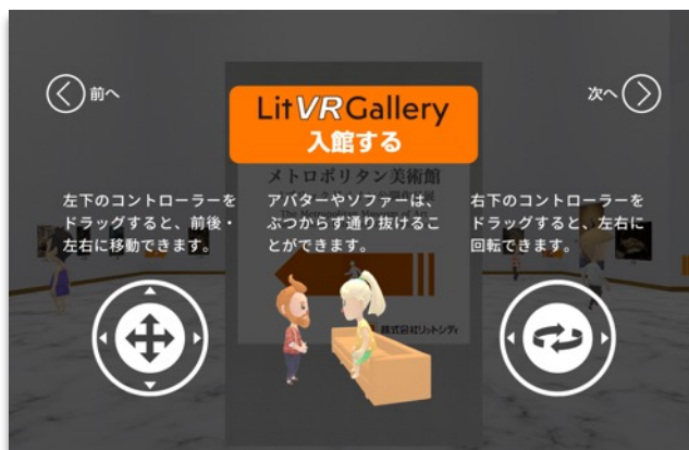
ヘルプ画面はわかりやすくビジュアルで説明