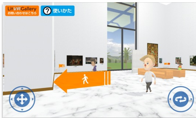
直感的な操作が可能なコントローラー

館内適所に順路を示す案内板を設置していますので、館内を迷うことなく、最後の作品まで鑑賞することができます。また、案内板やアバターなどは衝突せず、通り抜けることができますので、ウォークスルーの邪魔になりません。