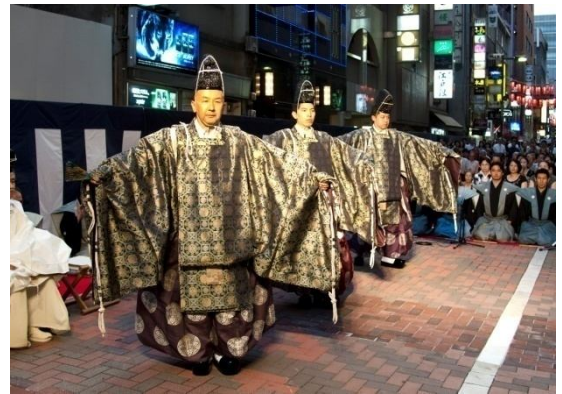
東京メトロ銀座線 銀座駅 A1出口より徒歩5分 JR 山手線 新橋駅 徒歩5分