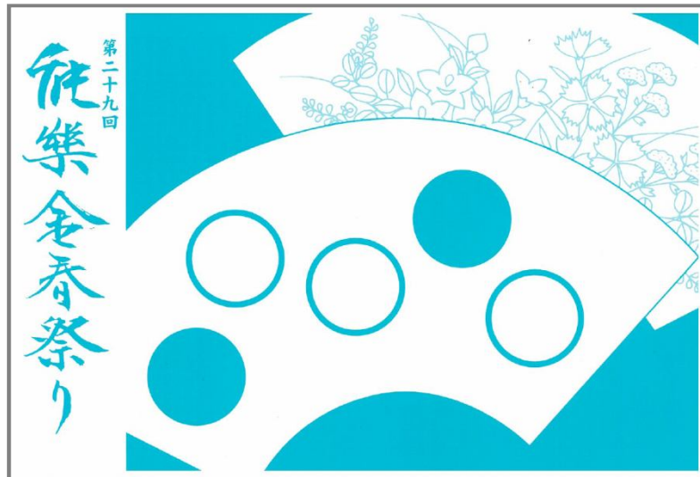
第29回『能楽金春祭りパンフレット』

能楽金春祭りでは金春流の決まり模様である「五星」の扇を金春色で配色したパンフレットを配布しています。