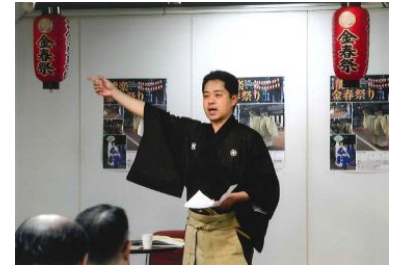
昨年の様子 講演『金春祭りと春日若宮おん祭り』