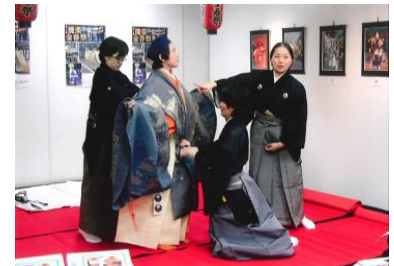
昨年の様子 能楽体験講座「装束」