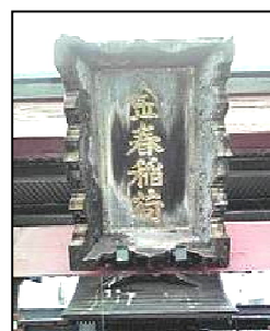
『見番屋上の金春稲荷』

金春稲荷は容姿端麗もさることながら、あらゆる教養を身に付け、粋に生きる女性達の守り神となっています。また商売繁盛の御利益もあります。