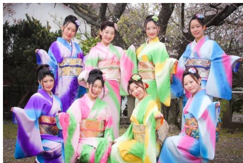
丹後小町踊り子隊(11日出演)