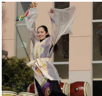
丹後七姫劇団(10日出演)