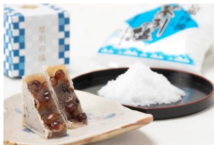
きんつば(琴引の塩)