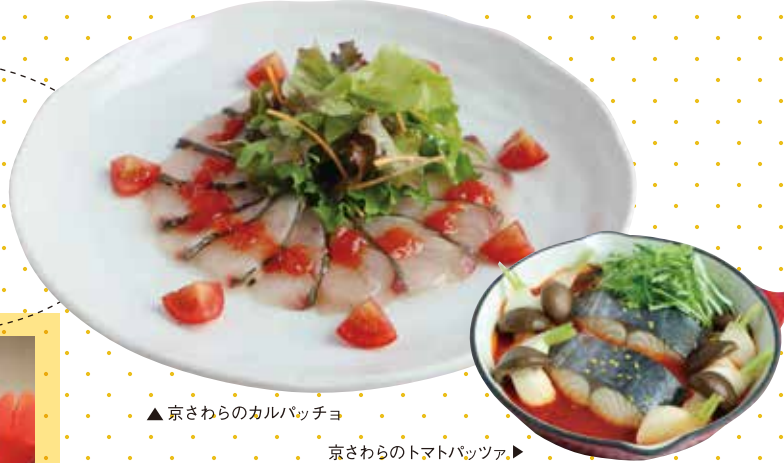
▲京さわらのカルパッチョ

京都府内の定置網で漁獲されるさわらは、京さわらと呼ばれます。脂がのっていて、甘味が強く身はやわらか。上品な味わいが魅力で、なかでも獲れたての京さわらの刺身はココでしか味わえない絶品です!