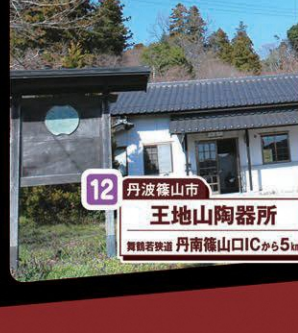
12 丹波篠山市 王地山陶器所 舞鶴若狭道 丹南篠山ICから5km