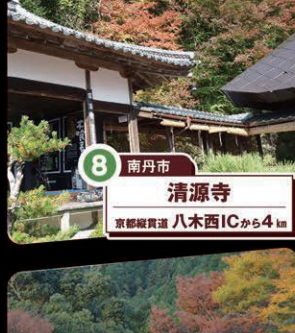
8 南丹市 清源寺 京都縦貫道 八木西ICから4km