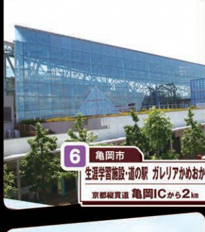
6 亀岡市 生涯学習施設・道の駅 ガレリアかめおか 京都縦貫道 亀岡ICから2km