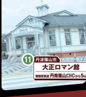
11 丹波篠山市 大正ロマン館 舞鶴若狭道 丹南篠山ICから5km