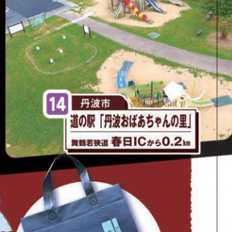
14 丹波市 道の駅「丹波おばちゃんの里」 舞鶴若狭道 春日ICから0.2km