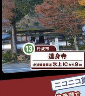
13 丹波市 達身寺 北近畿縦貫道 水上ICから9km