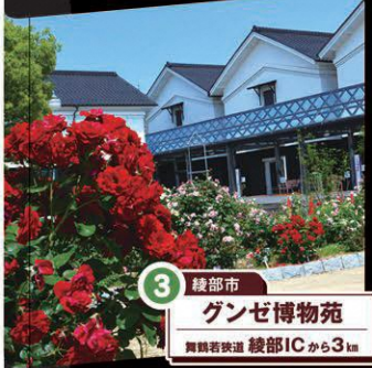
3 綾部市 グンゼ博物館 舞鶴若狭道 綾部ICから3km