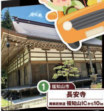
1 福知山市 長安寺 舞鶴若狭道 福知山ICから10km