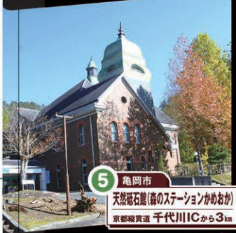
5 亀岡市 天然石彫(森のステーションかめおか) 京都縦貫道 千代川ICから3km