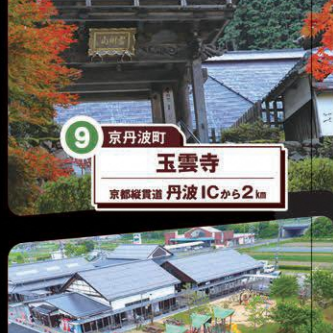
9 京丹波町 玉雲寺 京都縦貫道 丹波ICから2km