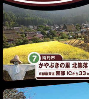
7 南丹市 かやぶきの里 北集落 京都縦貫道 園部ICから33km