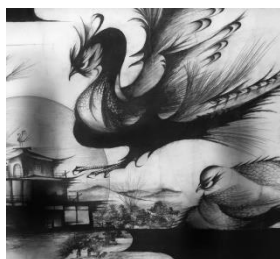
「やむを得ん」(部分) 2015~2018年

自ら撮影した写真などの資料をもとに鉛筆のみで描かれる瀧澤の作品は、モチーフごと、あるいは部位ごとに異なるパースの集合体で構成されます。そして一見すると写實的に映るそれぞれのモチーフですが、平等院鳳凰堂の屋根は渦を巻く火炎のように反り返り、また鋭い眼光の雉の翼には本来存在しない鉤爪が現れます。これらのデフォルメは瀧澤の作品に独特の強度と緊張感をもたらします。瀧澤はその左眼に差す光を通じ、何を視、捉えようとしているのか。塗り重ねられた黒鉛の奥に、その答えは隠されているのかもしれませんが。鋭く迫力のある鉛筆画の世界を是非ご覧ください。