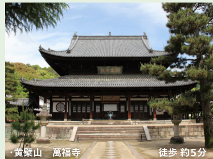
黄檗山 萬福寺 徒歩 約5分