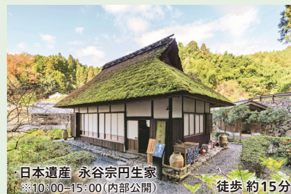
日本遺産 永谷宗円生家 ※10:00-15:00(内部公開) 徒歩 約15分