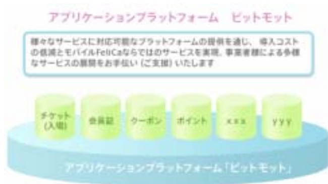
<ピットモットサービスイメージ図>