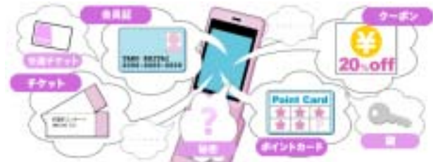
<ピットモット イメージ>

ピットモットはNTTドコモ、KDDI、ソフトバンクモバイルの3つの携帯電話会社から提供されているおサイフケータイに対応しており、事業者様が独自でケータイアプリを開発・維持管理する必要がありません。ケータイアプリに関するキャリアの手続きや技術を意識する必要がないため、開発、運用コストの大幅な削減、リードタイムの大幅な短縮が可能です。