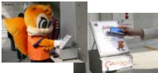
おサイフケータイからのチケット購入方法や試合日程は2枚目をご確認ください。