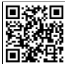
応募サイトQRコード

応募サイトURL: http://www.10weeks.jp/ (PC、携帯電話とも同じ)