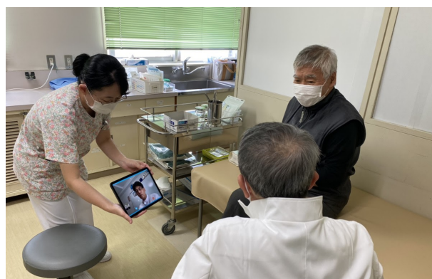
<入善セントラル病院> SOKUYAKU端末を用いて 病院内でオンライン診療を実施