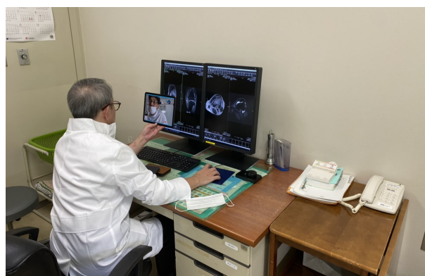
<入善セントラル病院> SOKUYAKU端末を用いて 事前にレントゲン情報を共有

この度の連携は、オンライン診療を前提とすることによる都市部との医師偏在問題の解決や、シェアリングによる医師の空きリソースの最適化に加え、病院内で看護師やヘルパーと受診できることから、高齢者のデジタル・デバイド解消にも寄与するものと考えます。