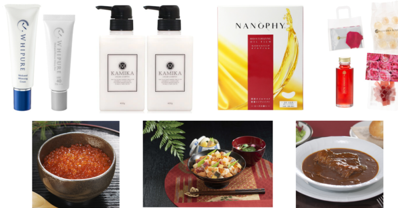
「VENDIN」でテレビショッピングの放送が決まった商品ラインナップ 事例

また、2021年1月以降、弊社で取り扱いのあった商品の合計売上金額は約1億7,000万円を突破。1回の放送での目標売上では、ある化粧品メーカーでは200%、シャンプーメーカーでは250%、食品メーカーで130%を達成するなど、順調に成果が生まれています。このように、メーカー・バイヤー双方のメリットを実証できたことから、この度の「VENDIN」本格提供開始に至りました。