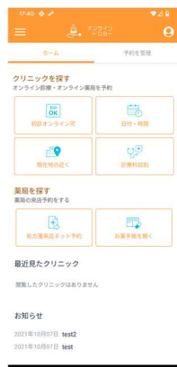
スマートフォン画面 イメージ