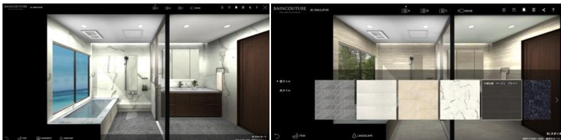
ブランドサイト シミュレーション機能

今回のブランドサイトの刷新では、理想とするバスルームに明確なイメージをお持ちでないお客さまでも、日々の暮らしの中のインスピレーションから、お風呂で過ごす時間と体験を想像していただけるよう、シミュレーション機能をご用意いたしました。“旅の記憶”“ホテルライクな暮らし”などライフスタイルからイメージを膨らませたり、バスルームのサイズ、形状、意匠に加え、窓から見える景色や、注ぎ込む光の陰影もシミュレーションが可能で、お客さまの過ごす空間と時間に想いを巡らすお手伝いをいたします。