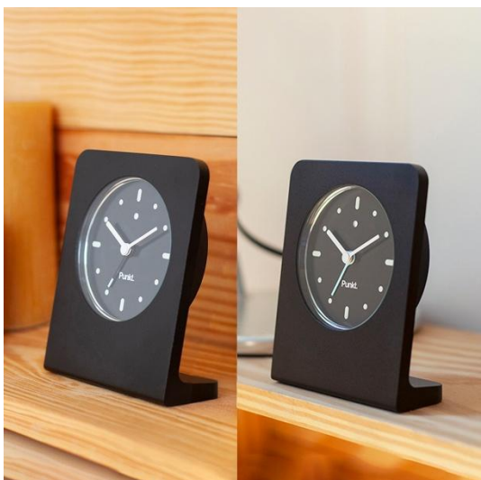
Punkt. AC02 alarm clock