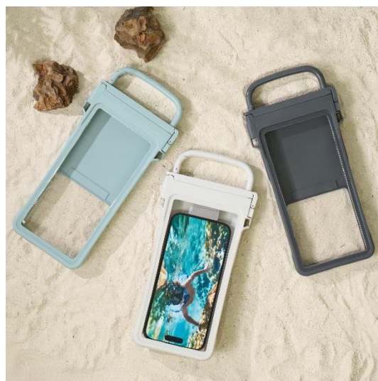
CARABINERCASE ※画像のブルーは当選対象外です。