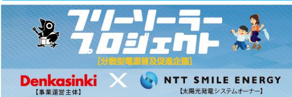
(左) 「デンカシンキ×NTTスマイルエナジーのフリーソーラープロジェクト」ロゴ