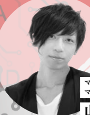
マーケティング部 マネージャー