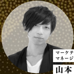
マーケティング部 マネージャー