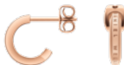
Elan Earring (イラン・ピアス)