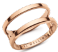
Elan Dual Ring (イラン・二連リング)