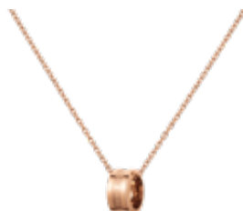
Elan Necklace (イラン・ネックレス)