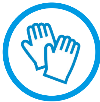
作業時は手袋必着