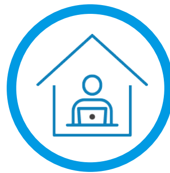
テレワークを実施