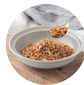
プレバイオティクス

https://myflora.jp 母の日ギフトセットの詳細はQRコードからご覧ください。