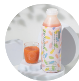
プロバイオティクス