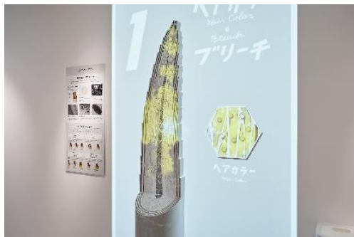
「仕組みに驚く」(プロジェクションマッピング)