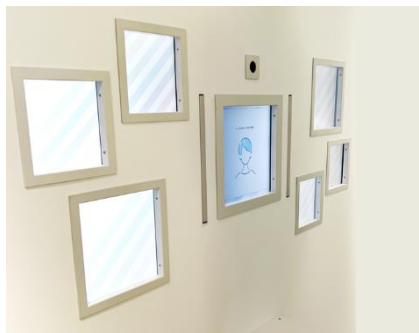
「なりたい自分を探す」(シミュレーター)