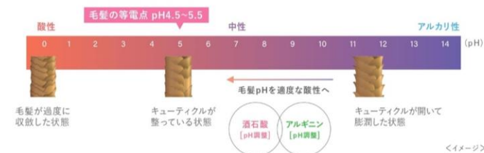
イメージ1：バッファー効果