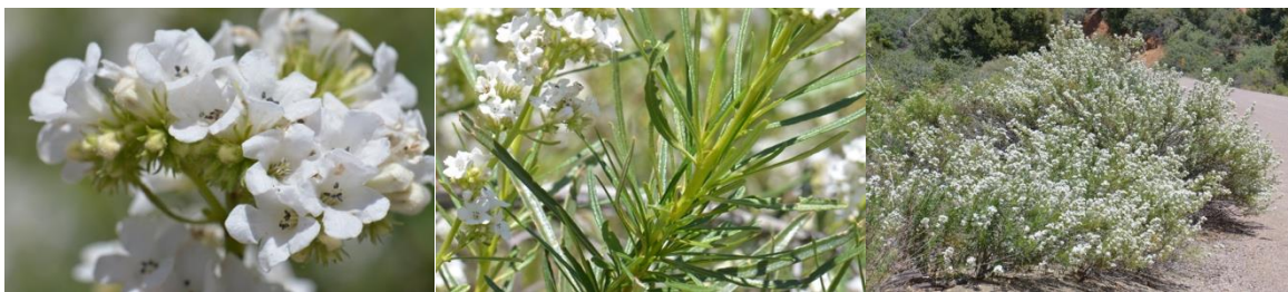
写真：ヤーバサンタ（エリオジクチオン属）

WEBサイトでは、ホーユーが15年以上の歳月をかけて取り組んできた研究の沿革とともに、ヤーバサンタに多く含まれるステルビンの白髪改善・予防に関するメカニズムの解説や、ヤーバサンタの紹介、研究者のインタビューを掲載しています。